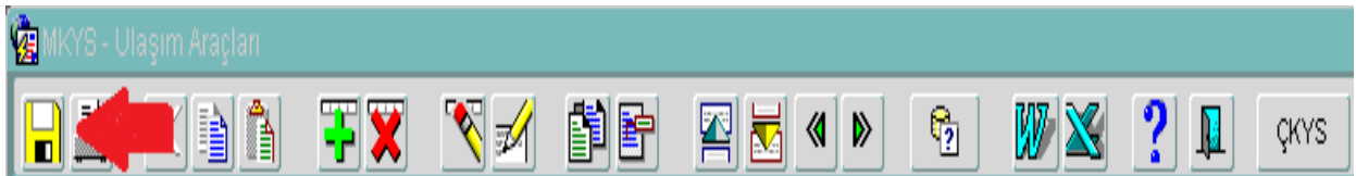
Görsel 10: Veri Kayıt

Ulaşım araçları ana ekranının sol üst köşesindeki sarı renkli “ Kaydet Butonu ”na tıklanarak, girişi yapılan araç verilerinin kayıt işlemi tamamlanır.