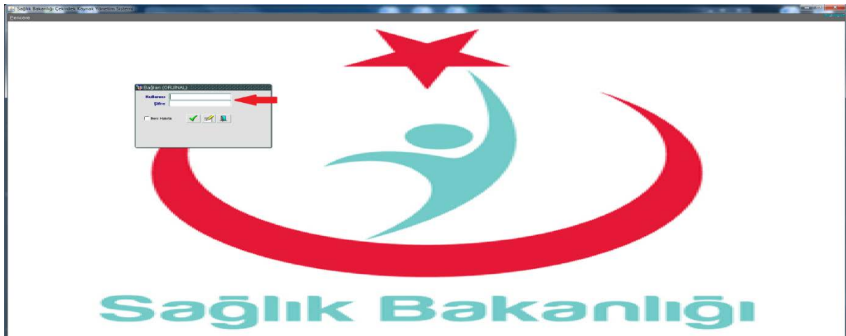
Görsel 1: Kullanıcı Girişi

Malzeme Kaynakları Yönetim Sistemi (MKYS) kullanıcı girişi.